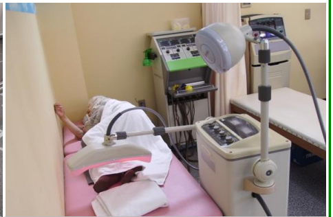
電気療法・温熱療法