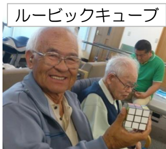
ルービックキューブ