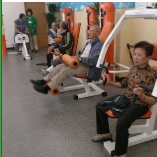
筋力トレーニング