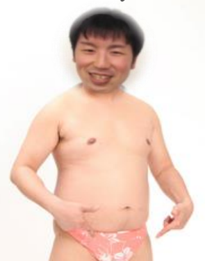
とにかく明るい岸