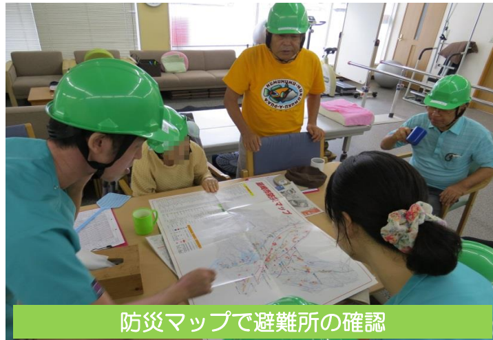
防災マップで避難所の確認