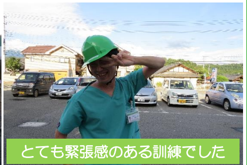
とても緊張感のある訓練でした