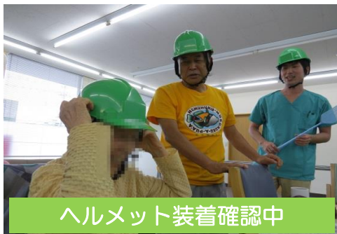
ヘルメット装着確認中