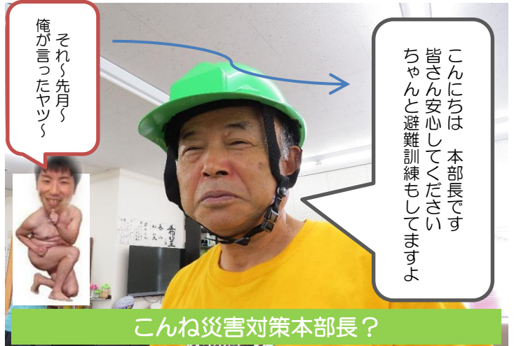
こんね災害対策本部長？