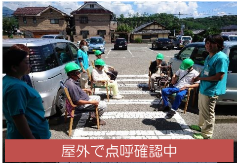
屋外で点呼確認中