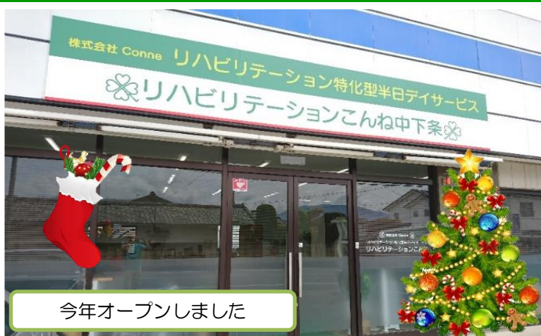
今年オープンしました