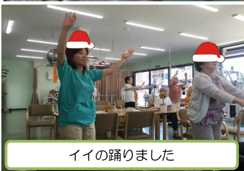
イイの踊りました