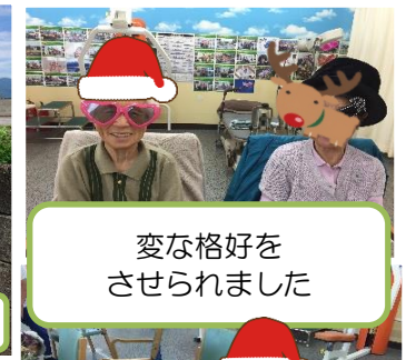
変な格好を させられました