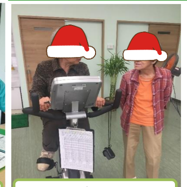
出会いがありました