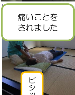
痛いことを されました