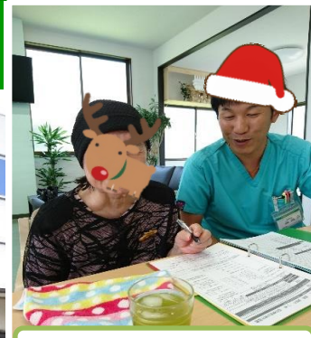
契約させられました