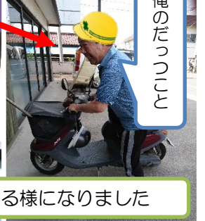
シゴかれて、出来ないことが出来る様になりました