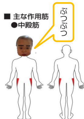
股関節を開く動作のトレーニングが行えます。