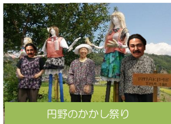
円野のかかし祭り

7つの漢字を使い二字熟語をしりとりで作ります。できた二字熟語の右側の漢字が次の二字熟語の左側の漢字になります。答えの最初と最後の漢字は1度しか使いません。うまく繋がるようにマスを埋めてください。