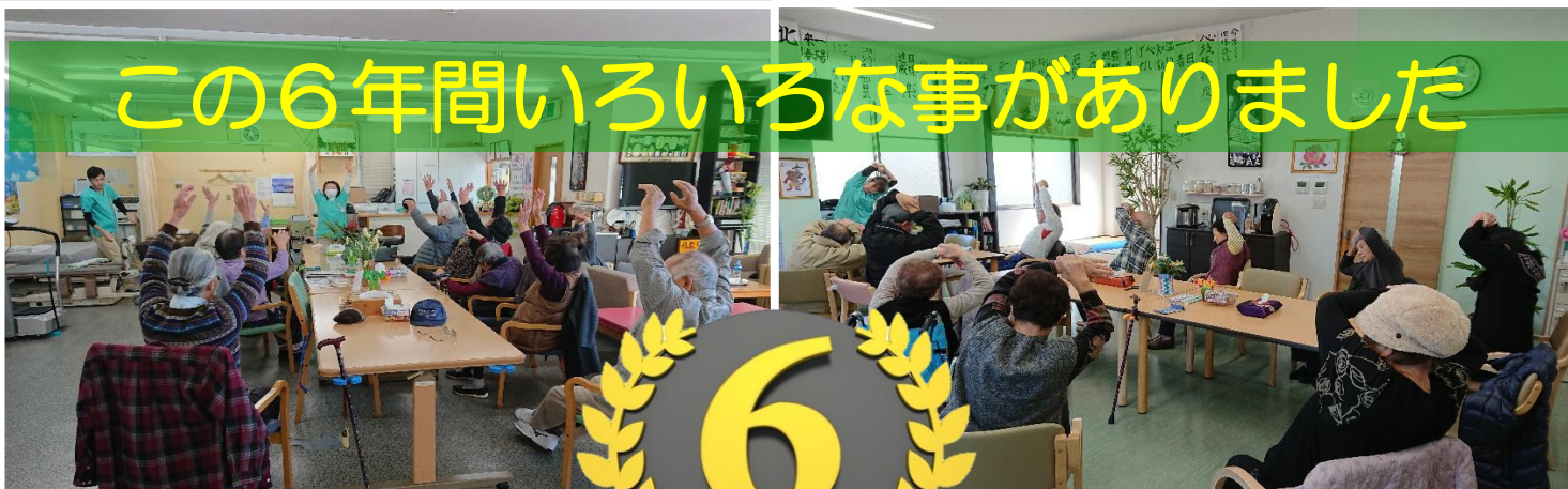
こんね藤井の利用者がこんなに増えました