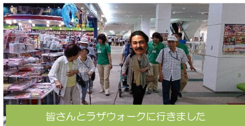
皆さんとラザウォークに行きました