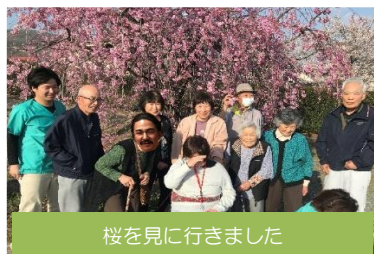
桜を見に行きました