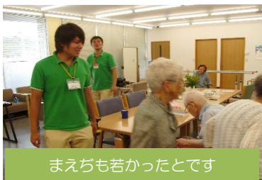
まえちも若かったとです