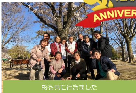
桜を見に行きました