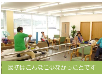
最初はこんなに少なかったとです