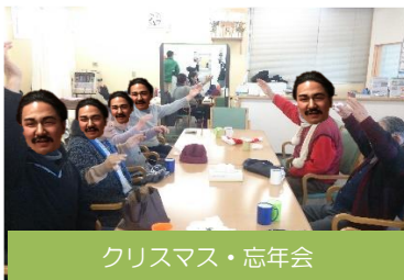
クリスマス・忘年会