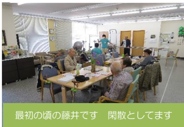
最初の頃の藤井です 閑散としています