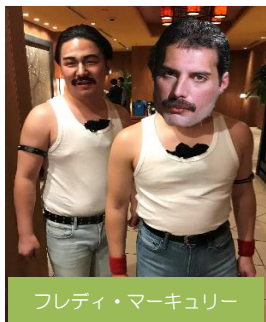
フレディ・マーキュリー